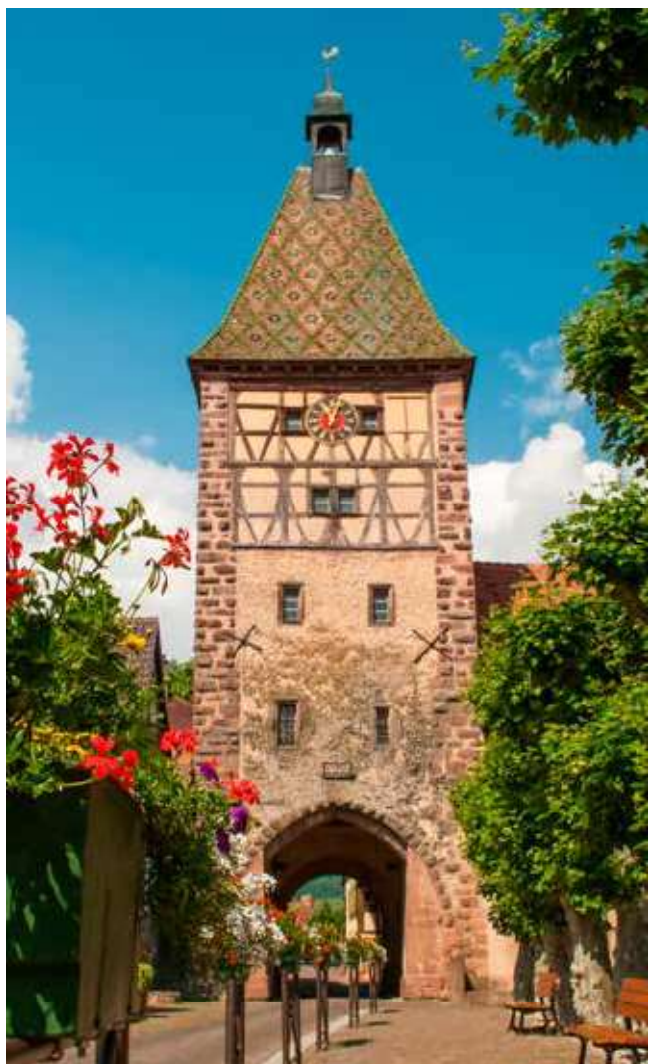
Stadspoort van Bergheim

Overbergen blijkt de Nederlandse vertaling te van de oude plaatsnaam van het stadje Bergheim in de Elzas.