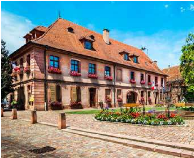
Gemeentehuis van Bergheim

In de Napoleontische tijd werden veel jongens verplicht of geronseld om mede op te trekken met het Franse leger, vooral de Elzas was een belangrijke leverancier van manschappen en ook van materiaal en de vraag naar smeden was in die tijd zeer groot.